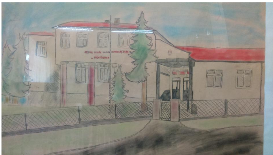
Karol Wrzosek kl. IA